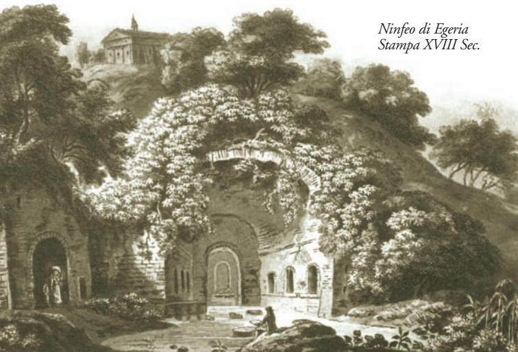
Ninfeo di Egeria Stampa XVIII Sec.

Passati i secoli la valle divenne proprietà di alcune delle più illustri famiglie romane che la arricchirono di ville, templi e sepolcri. Il carattere agreste della valle non cambiò con la caduta dell'impero, sorsero le prime torri di avvistamento a difesa dei fondi agricoli, quindi i casali