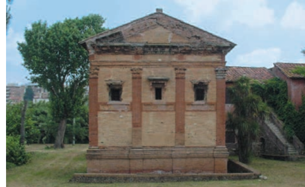
Sepolcro Annia Regilla

primo fra tutti Antonio Cederna, la valle ha subito poche ferite, inserita nel più ampio sistema del Parco Regionale dell'Appia Antica, e risanata nella parte acquisita dal Comune di Roma (ben 132 ettari) alla fine degli anni '90, è ora godibile da tutti. Oggi, una passeggiata nella Caffarella, è un'avventura emozionante in un contesto unico, tra segni della storia romana, pecore al pascolo e una natura rigogliosa, il tutto a due passi dal centro storico della città di Roma.