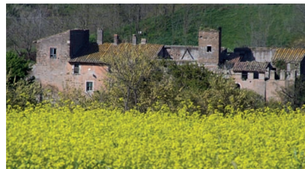
Casale della Vaccareccia

complesso monumentale paesistico costruito da Erode Attico in memoria della moglie Annia Regilla e successivamente, del grande complesso intorno al palazzo imperiale di Massenzio. La valle risulta in abbandono sul finire dell'epoca imperiale. In epoca feudale, l'area intorno alla via Appia era proprietà dei Conti Tuscolani che l'avevano fortificata e militarizzata per controllare ogni transito verso i loro possedimenti del Tuscolo. L'abbondanza delle acque esistenti nella zona permetteva l'attività agricola e quella artigianale, numerosi sono dunque gli impianti alimentati dalla