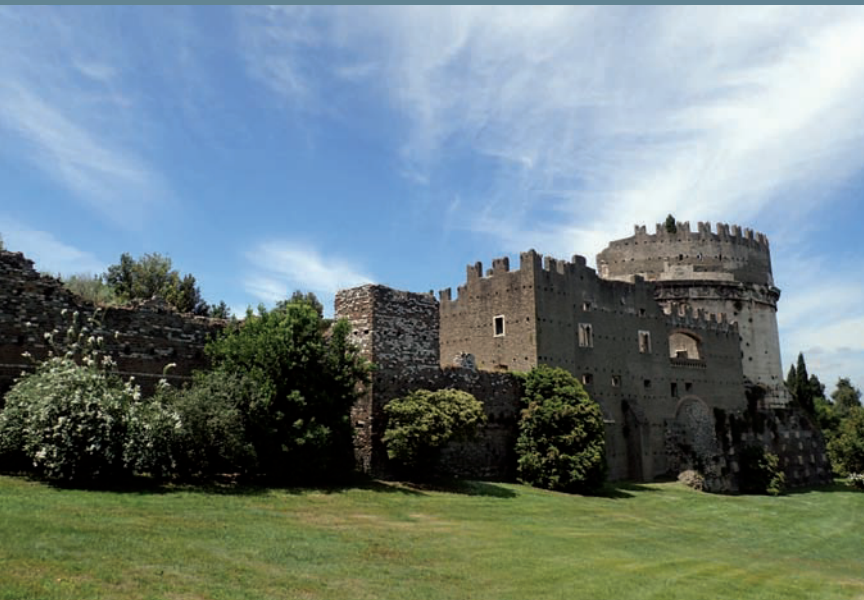
Il Castrum Caetani, visto dalla proprietà Greco.