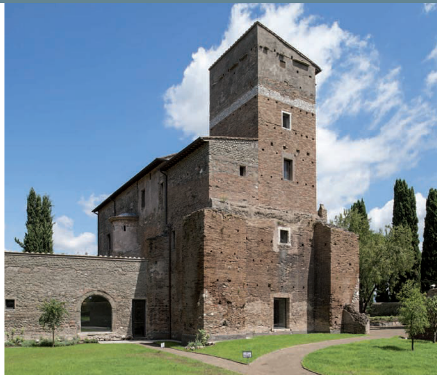
Il Casale di Santa Maria Nova.

Villa dei Sette Bassi: apertura straordinaria 10.00 - 17.00 (via Tuscolana, 1700, Metro A Fermata Anagnina). Casale di Santa Maria Nova, mostra "Gianni Berengo Gardin. Roma" e visite guidate: 10.00-14.00 (Via Appia Antica 251, Roma).