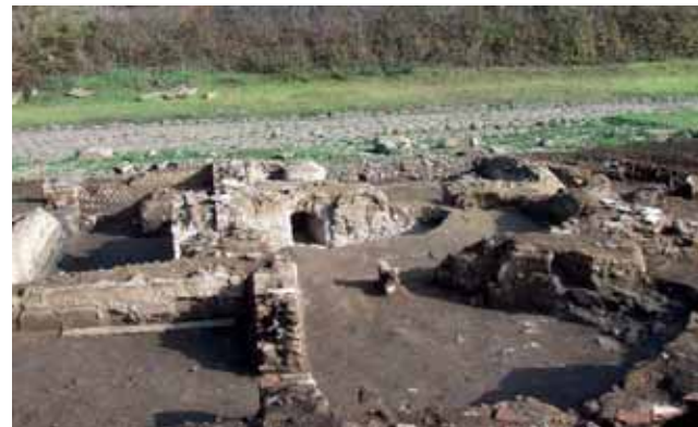
La Statio a Santa Maria delle Mole

Il probabile inizio dell'attività del Vulcano Laziale è databile intorno ai 600.000 anni fa, essa è suddivisa in tre fasi principali: l'attività Tuscolano-Aremisia (circa 600.000-360.000 anni fa), in cui le manifestazioni prevalentemente dovute all'edificio centrale sono responsabili del 97% dei prodotti totali depositati (280 Km 3 ). Durante questa fase si verificano 4 cicli costituiti dalla messa in posto di colate piroclastiche e di piroclastici e di lave a chiusura dell'attività.