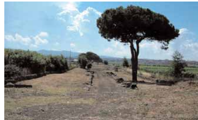
Via Appia Antica da via Capanne di Marino

Nel V secolo il collasso dell'Impero Romano provocò la rovina delle infrastrutture che ne avevano costituito l'ossatura. L'Appia non sfuggì al generale sfacelo, ma il solo tratto funzionante rimase proprio quello da Roma ai Colli Albani.