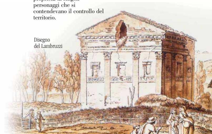
Disegno del Labruzzi

cross vault roof, in the centre of which is a circular recess for a medallion; on the walls we can see traces of the stuccoes and frescoes which decorated it; the floor has collapsed entirely; there remain traces of it only in the four corners. A drawing by Carlo Labruzzi dating from the end of the eighteenth century shows the building still in good condition; at the time it was used as a barn. Next to it are a farmhouse and a tower. In fact, an ancient farmhouse still stands nearby, which comprises the remains of an old fulling-mill, or valca (from the Longobard “walkan”, “to roll”), a system used to wash clothes; from surviving documents on the plague of 1656 we know that during the epidemic the fulling-mill was used exceptionally to wash infected bed-clothes. The tower, which does not survive, was part of the Caffarella valley's defensive system. During the Middle Ages the valley was surrounded by a number of watchtowers constructed on the various fords of the Almone river, and which were owned by different individuals who competed for control over the territory.